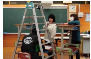
ケーブルテレビ授業の撮影の様子

3年前の4月・5月、新型コロナウイルスの関係で、休校となった時期がありました。その当時、河合小職員は、子どもの学びを止めないようにと、ケーブルテレビの授業配信をしました。子どもたちは、プリント学習と併用し、学びを続けました。保護者の皆様に助けていただいた2ヶ月でした。