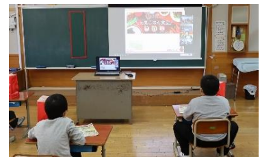
オンライン授業配信の様子