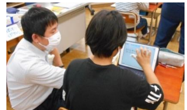
タブレットを活用した学習の様子

今では、オンラインでつないで、他校と授業や交流をしています。コロナ禍ということもあり、自宅とつないで、配信することもありました。宿題の提出も、紙のノートではなく、タブレットを通して提出することも行ってきました。自ら写真を撮るような学習では、タブレットを使ってプレゼン形式で発表ができるようになってきました。